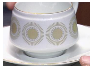
Olga Osolinin Arabialle suunnittelemaa Bellis-sarjaa valmistettiin 1960-luvulla.