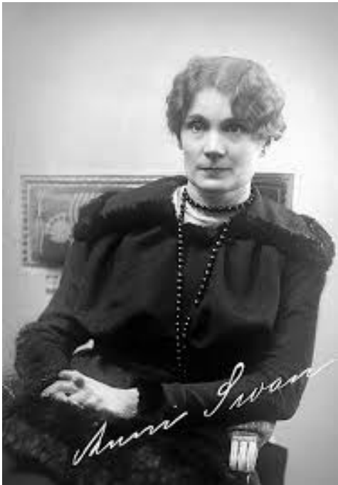
Anni Swan 4.1.1875-24.3.1958