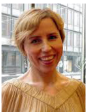
Ohjaus: Virpi Suutari

Eedenistä pohjoiseen on dokumentaarinen rakkauselokuva suomalaisista pariskunnista, jotka hoitavat yhdessä puutarhojaan. Komediallisesti viiritetyssä elokuvassa kurkistetaan pensasaitojen sisäpuolella pariskuntien kertomuksiin pitkien parisuhteiden ristiriidoista ja iloista.